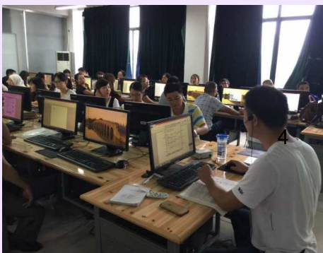
湖南电脑技术培训课上