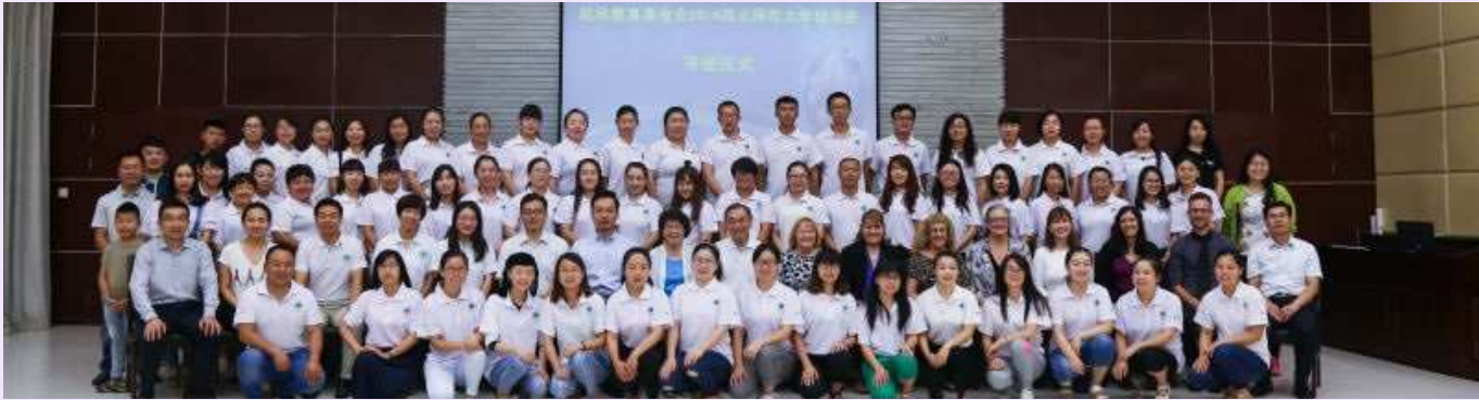
兰州培训全体师生合影