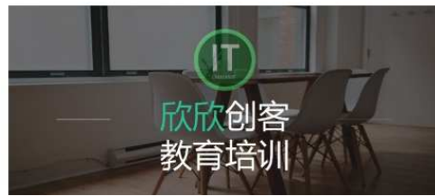
三门在线课程首页

欣欣英语教学技能培训 面向欣欣教育基金会支持的农村英语教师师资培训 共117课 | ★★★★★ | 143人在学