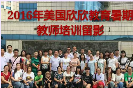
吉林培训全体师生合影