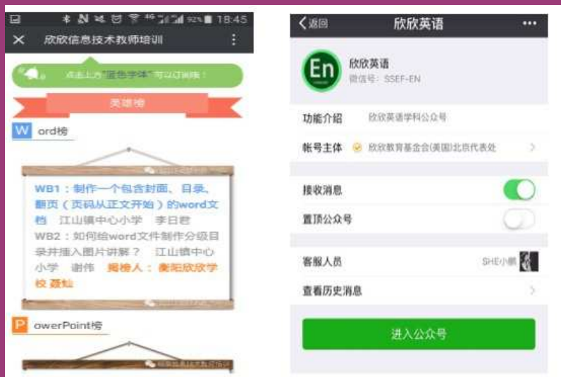
在线课程与微信公众号

没有技术和服务团队，孙众则想到她的学生们。作为担任教育学院师范学生专业课程的教师，她提出将在线课程的开发与师范生的培养相结合，既可找到制作在线课程的人员，又可使这些准教师们把