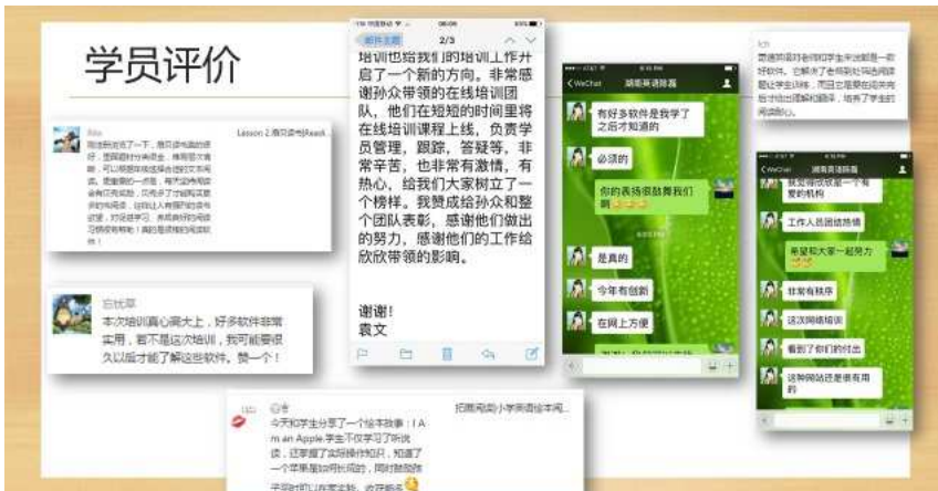
参加培训学员对课程的评价

为了方便农村教师参与学习，课程不仅在在线平台上进行呈现，还建立了三门课程的微信公众号，同步更新教学内容，为教师提供多元化的教学资源以及获取方式。如信息技术课程公众号发布了互动活动——龙虎榜，即榜上会放置利用Word或PowerPoint制作的任務，教师可通过摘榜得到相应成绩；欣欣英语公众号推送图文消息23次、累计82篇图文内容，教师对于微信公众号的关注人数达到了报名人数83%。