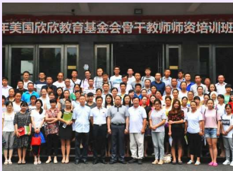
湖南培训全体师生合影