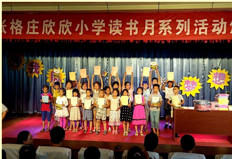
张格庄欣欣小学读书月活动颁奖仪式