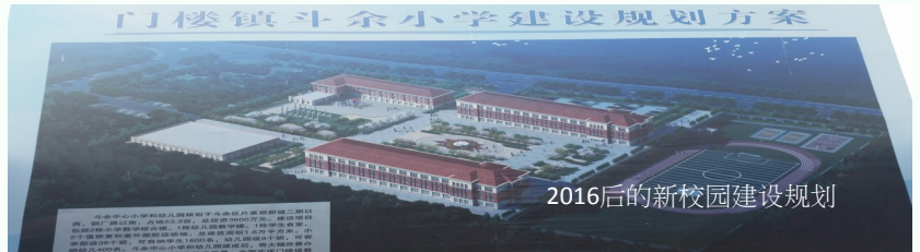
门楼镇斗余小学建设规划方案