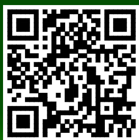
欣欣教育基金会官网